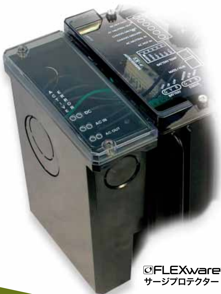
FLEXware™ サージプロテクター

OutBack PowerのFLEXwareサージプロテクターは、FXシリーズのインバーター/チャージャー向けの、シームレスに統合されたバランスオブシステム (BOS) コンポーネントです。OutBack FXシリーズのインバーター/チャージャー用にOutBack Powerによって特別に設計されたFLEXwareサージプロテクターは、電気サージの発生時に、インバーター/チャージャーの極めて重要な電気部品を様々なレベルで保護します。洗練された設計によって、熱溶解した金属酸化バリスタ (MOV) を介して複数回路 (AC x 2, DC x 1) のACとDCを保護することができます。LED視覚インジケータは、ひと目で分かるステータス監視機能を備え、これによってシステムの利用者はFLEXwareサージプロテクターの動作状況をリアルタイムで把握できます。FLEXwareサージプロテクターは、120~240 VAC、50/60Hz、および12~48VDCで動作するように設計されています。複数取り付けの構成によって、あらゆるOutBack電力システムへの組み込みが可能です。