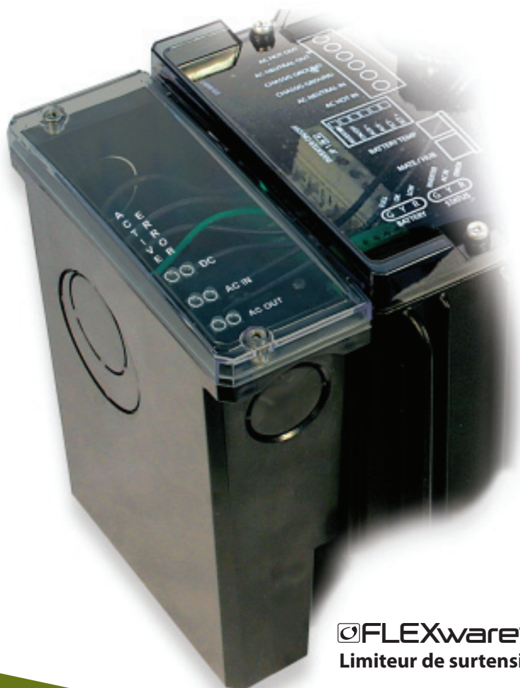
FLEXware™ Limiteur de surtension

Le limiteur de surtension FLEXware d'OutBack Power constitue un ajout parfaitement intégré à l'onduleur/chargeur de la série FX. Les ingénieurs d'OutBack Power ont conçu le limiteur de surtension FLEXware spécifiquement pour les onduleurs/chargeurs de la série FX d'OutBack, de manière à offrir plusieurs niveaux de protection aux composants électriques de l'onduleur/chargeur en cas de surtension électrique. La conception sophistiquée offre une protection du CA et du CC sur plusieurs circuits (deux CA et un CC) par l'entremise de varistances à oxyde métallique (MOV). Les indicateurs visuels à DEL permettent aux utilisateurs de vérifier en un coup d'œil et de surveiller en temps réel l'état fonctionnel du limiteur de surtension FLEXware. Le limiteur de surtension FLEXware est conçu pour fonctionner dans des plages s'étendant de 120 à 240 V CA à 50/60 Hz et de 12 à 48 V CC. Ses multiples configurations de montage permettent de l'intégrer à tout système OutBack Power.